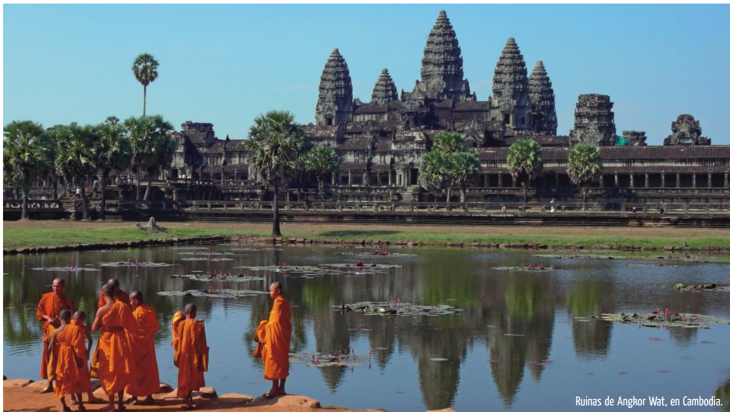
Ruinas de Angkor Wat, en Cambodia.

Por Lucía Rodríguez Bortoni :: lrodriguez@viajeslegrand.com