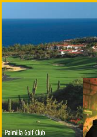
Palmilla Golf Club

Famosos diseñadores de campos de golf como Nicklaus, Fazio, Dye, Love, Couples y Mickelson tienen gran influencia en el paisaje golfístico de Los Cabos. Desde San José del Cabo hasta Cabo San Lucas, los campos de golf han sido primorosamente diseñados sobre el terreno desértico y acentuados por el Mar de Cortés y el Océano Pacífico.