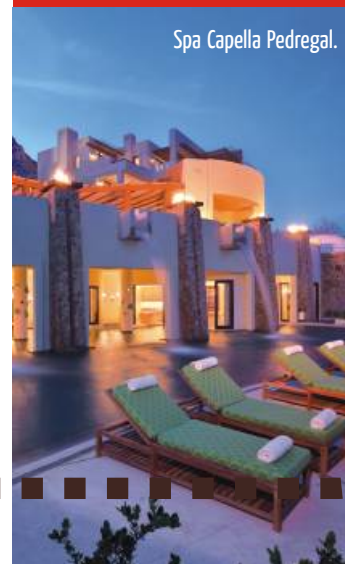
Spa Capella Pedregal.