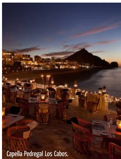
Capella Pedregal Los Cabos.

Este Arco que se formó en donde el Mar de Cortés se encuentra y se une con el Océano Pacífico muestra su belleza junto con los picos de las montañas de Sierra de la Laguna, la arena dorada de las playas, la majestuosidad del mar y los colores del cactus saguaro, palmas y jardines cultivados que dan vida al pálido desierto. ME