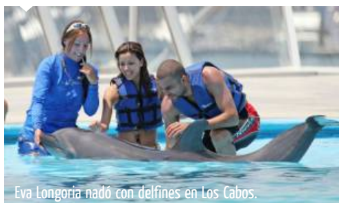
Eva Longoria nadó con delfines en Los Cabos.

Anímate a vivir la gran experiencia de nadar con Delfines y en Los Cabos hay dos excelentes opciones para hacerlo: Cabo Dolphin Center y el Cabo Dolphins , donde podrás tener una completa interacción con los mamíferos marinos al saludarlos con su aleta y porque no, hasta darles besos.