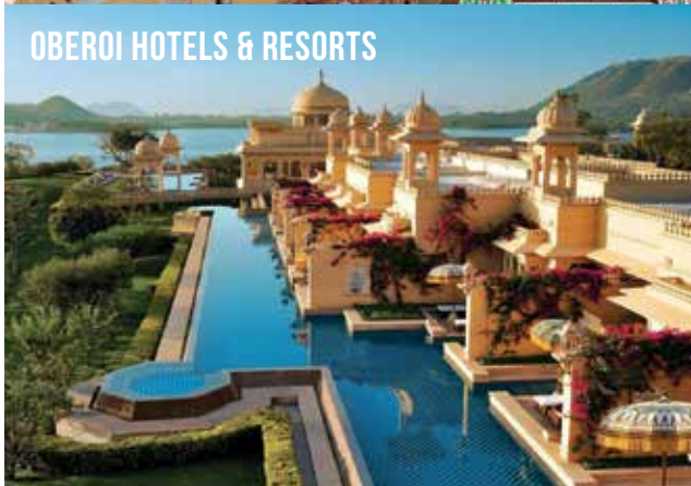
OBEROI HOTELS & RESORTS